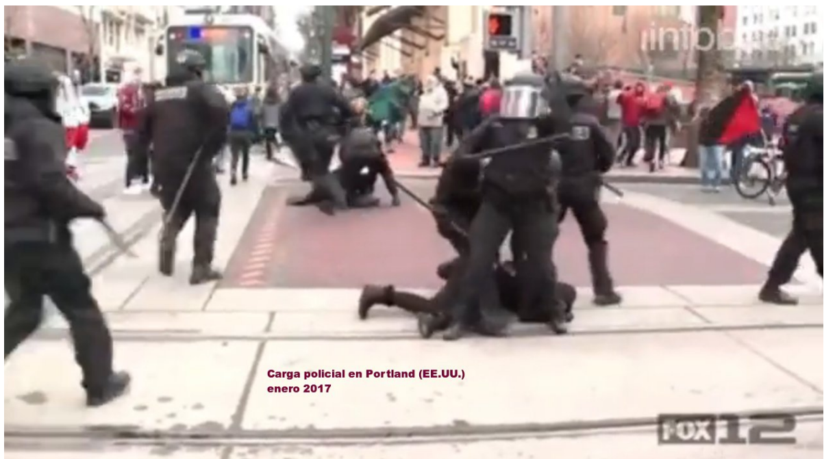
Carga policial en Portland (EE.UU.) enero 2017