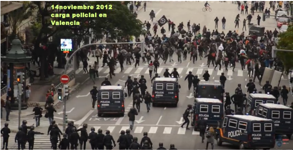
14 noviembre 2012 carga policial en Valencia