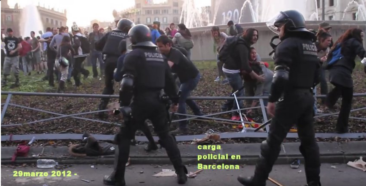
carga policial en Barcelona