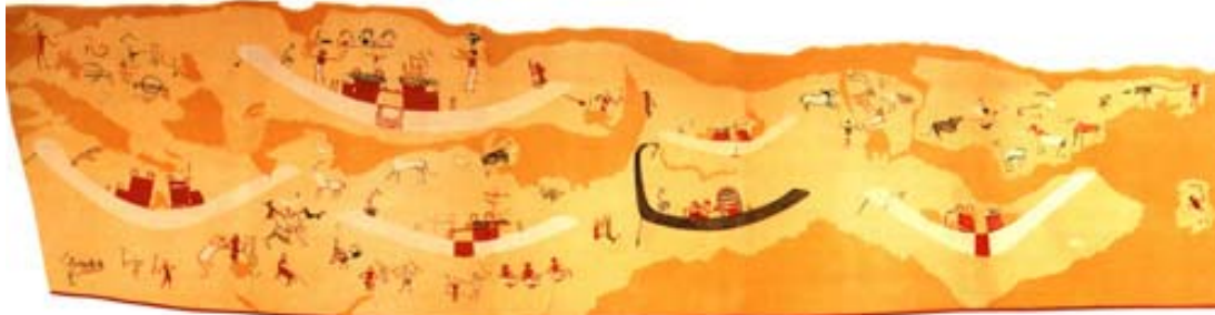
Escena en una de las paredes de una tumba predinástica, cerca de Nagada, donde se representa la huida, el día del Gran Cataclismo. La tumba es de la época del rey Escorpión y data de antes de la dinastía I (hacia el 5000 a.C.).

Después de este minicataclismo , la vida de Ahâ-Men-Ptah se reagrupó más al sur y transcurrió apaciblemente durante cincuenta siglos, hasta el momento en que nació el primer Ahâ , el Primogénito Usir, u Osiris, engendrado por la Divinidad en Nut, inminente esposa de Geb (que fue debidamente prevenido del hecho) quien, por su parte, sería el penúltimo rey de aquella tierra.