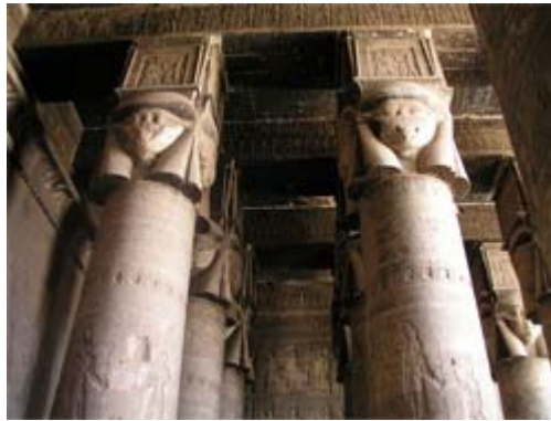
Columnas del templo de Hathor, en Denderah. Este templo, de periodo grecorromano, es uno de los mejor conservados.

He hecho elevarse al Astro del Día sobre el horizonte de mi Corazón, pero para que así sea he instituido la Ley de la Creación que actúa sobre la Parcelas de mi corazón para animarlas en los [corazones] de mis Criaturas. Y así fue. (3)