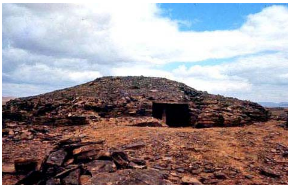
Tauz, situado en el desierto del Sahara, al sur de Marruecos.

Y no sólo los devotos de Ptah conservaron su uso con un sentido tanto religioso como político, sino que también los adoradores de Ra – como deidad independiente y no como manifestación de Ptah – lo habían aceptado, aunque bajo otra forma, con otros minerales, como en el caso de Ramsés el Grande .