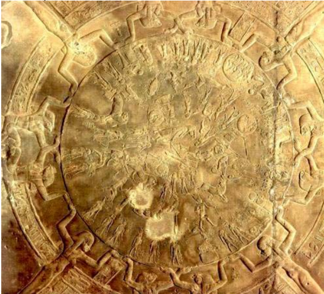
Zodiaco del templo de Hathor, en Dendera.

Esto ocurría, según Slosman , el 27 de julio de 9,792 antes de nuestra era , fecha que consideraba inequívoca gracias a la lectura e interpretación de los acontecimientos narrados en el planisferio celeste grabado en el techo de una de las salas del templo de Denderah, más conocido con el nombre de “zodiaco”.