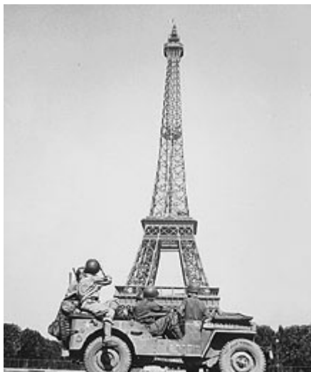
Soldados americanos durante la Segunda Guerra Mundial.

Un accidente banal, una caída que le fracturó el cuello del fémur en los corredores de la francesa Casa de la Radio , en la que había sido citado para una entrevista por los hermanos Bogdanov, acabó con su vida, quizá porque su cuerpo – su carcasa humana, como él lo llamaba – ya muy quebrantado, no soportó una agresión más, por insignificante que ésta fuese.