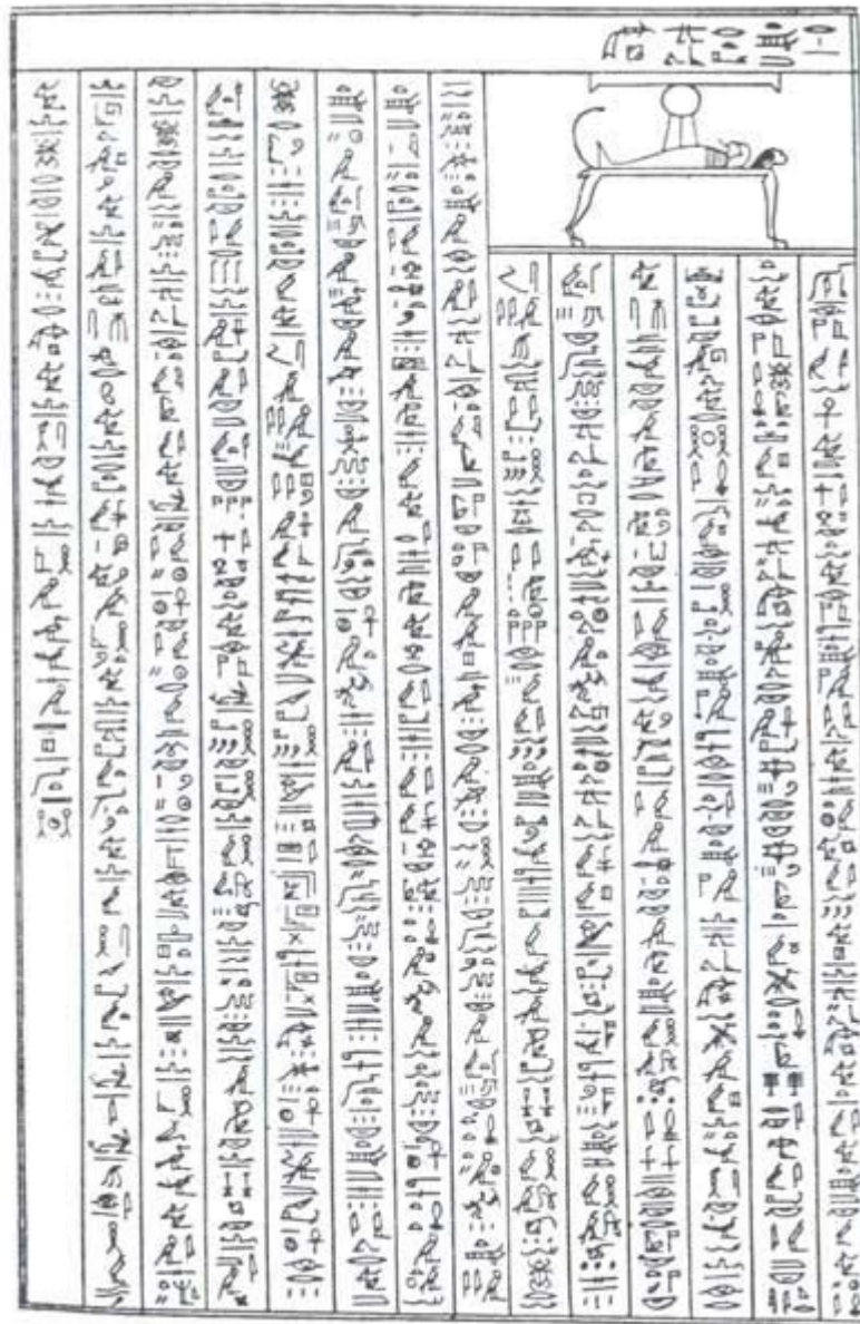
Extracto del Libro de los Muertos egipcio en el que se narra la epopeya de los supervivientes y la resurrección de Osiris.

Sólo le quedaba, decidió, volver a Tamarar para verificar si se trataba, verdaderamente, de la antigua Ta Mana de los textos egipcios , el lugar al que habían arribado los supervivientes de Ahâ-Men-Ptah .