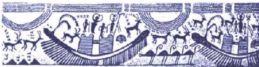
Cerámica predinástica en la cual, según Slosman, puede estar representándose también el Gran Cataclismo.

Y fue poco antes de que Hor sucediese a su padre, cuando Usit atacó la capital de Ahâ-Men-Ptah con tropas rebeldes reclutadas al efecto, iniciando así el proceso de hundimiento del continente, pues al asesinar a Usir a lanzazos, la cólera de Dios se desencadenó sobre las criaturas y sobre Su creación.