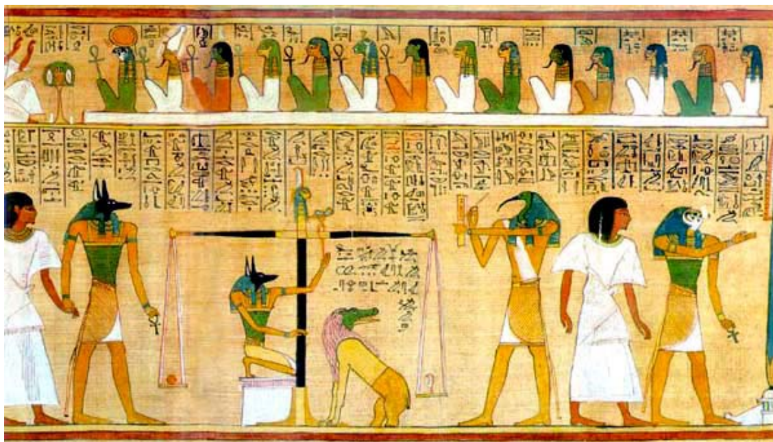
El papiro Ani, quizás el más famoso de los Libros de los Muertos egipcio. Fue hallado en Tebas y se cree que pertenece al siglo XIV a.C.